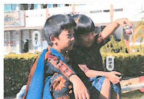
信心與成長的記號