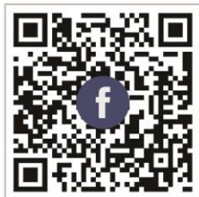
FB QR code