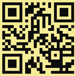
官方網站消息連結

主辦單位：臺北醫學大學、臺北醫學大學進修推廣處 指導單位：教育部、衛生福利部 承辦單位：臺北醫學大學楓杏醫學青年服務團 協辦單位：北醫附設醫院、萬芳醫院、雙和醫院 課外活動指導組、北醫各系所學科