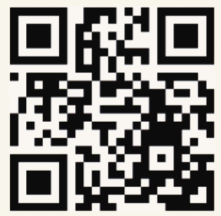
報名表單填寫連結