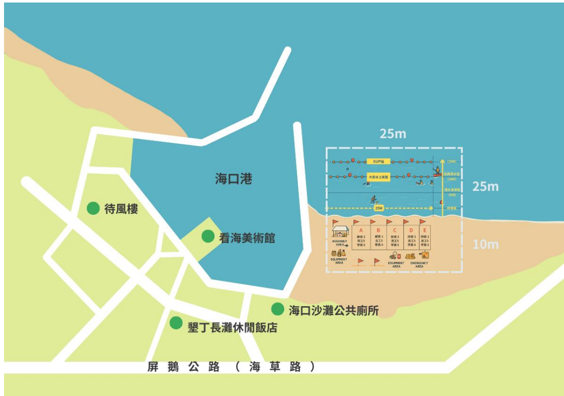
圖 1 海域安全推廣教育活動場域示意圖